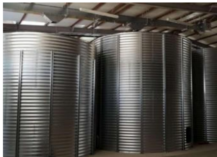
Silo à céréales de la Malterie,

Ainsi, La Malterie de l'Ouest porteuse du projet et créée à cette fin a dans un premier temps, en raison de la disparition du métier, conçu un référentiel technique puis dans un second temps a élaboré tout le système de production adapté puisque la volumétrie visée est nettement moindre que celle des brasseries industrielles utilisatrices de ces machines.