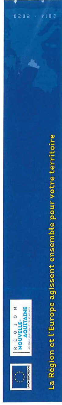
TABEAU RECAPITULATIF DES DOSSIERS RELEVANT DU PROGRAMME OPERATIONNEL FEDER/FSE POITOU-CHARENTES 2014-2020