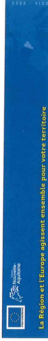
TABEAU RECAPITULATIF DES DOSSIERS RELEVANT DU PROGRAMME OPERATIONNEL FEDER/FSE POITOU-CHARENTES 2014-2020